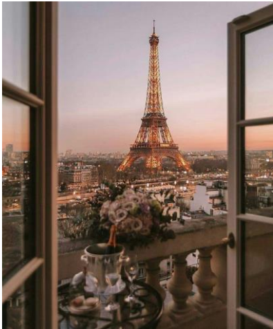
Torre Eiffel - Paris

*Um giro completo pelo interior da França, este roteiro vai mexer com os seus 5 sentidos*