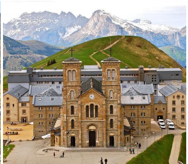
Santuário Nossa Senhora da Salette - La Salette

Período: 07 a 22 de Junho de 2024 - 17 Dias - Roteiro nº 240614F03