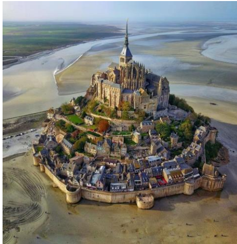
Mont Saint Michel